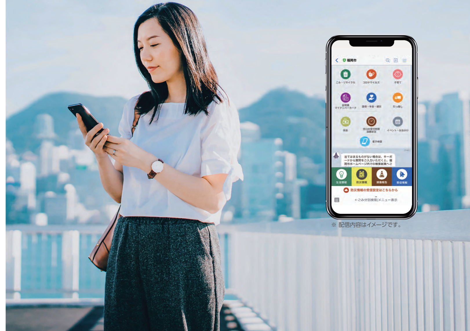
※ 配信内容はイメージです。